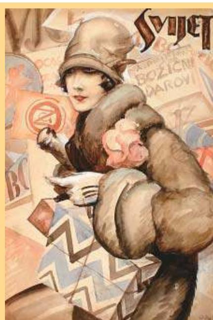
Božićni darovi: Naslovnica iz 1926.