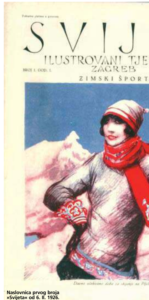
Naslovnica prvog broja »Svijeta« od 6. II. 1926.

segment izložbe, nezaobilazni su dio inventara ludih dvadesetih, a Antonini je bio njihov dio koji ih dokumentira poput kakva »vesela« Toulouse Lautreca, ne zaboravljajući često ni svoj karikaturistički habitus. Paralela s velikim francuskim majstorom koji je ovjekovje-