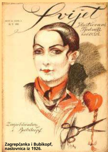
Zagrepečanka i Bubikopf, naslovnica iz 1926.