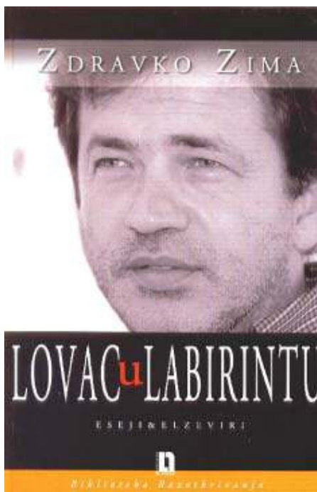
Zdravko Zima: »Lovac u labirintu, eseji & elzevirski«, Naklada Ljevak, Zagreb 2006., str. 46

»Lovac u labirintu« kratke je izvanrednim uvidima dobro obaviještena pisca čije će referencije na literaturu kultivirati čitateljski duhovni aspekt pokušavajući na opušten, na nekim mjestima ironičan način oživjeti njezin smisao. Zima se u svojim tekstovima ne razmeće bez pokrića, a pohranjeno znanje o europskoj literaturi, umjetnosti, glazbi, koje je utisnuto u intimni kod knjige primijetili su oni koji mu to epistola, umjesto stereotipnog pogovora, i priznaju. I stoga je ovo knjiga o njegovu nastojanju da u »procesu individualizacije dođe do samoga sebe«, znanje u njoj tek je nužan korak u oslobađanju duše od okova osjetilne zaspalosti u ispraznom svijetu svakodnevnih zabuda. Zima je moderni intelektualac, »arogantni sveznadar« koji je još jedanput pokazao kako se dostojanstvo riječi brani njima samima. Pri tome je svoju privatnu duhovnu rezidenciju ustoličio u vedutama Venecije, San Gimignano, Pule, Praga, Malinske, Splita i Zagreba, pozvavši na banket samo pažljivo probrana imena.