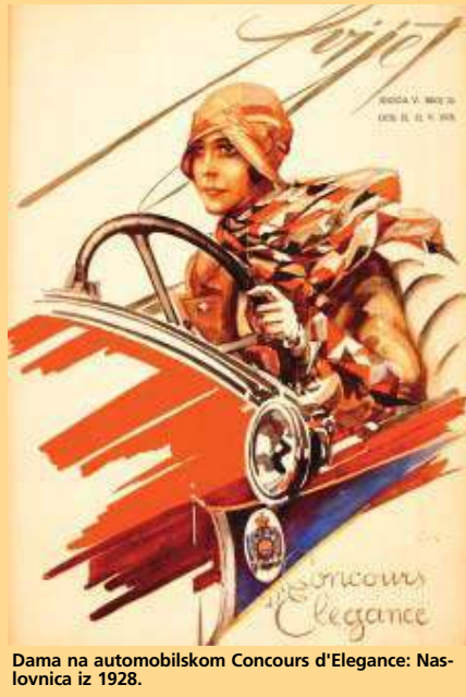
Dama na automobilskom Concours d'Elegance: Naslovnica iz 1928.